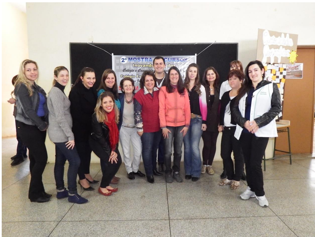
Professores e funcionários do Colégio