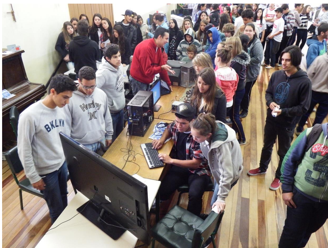
Divulgação do curso Técnico em Informática